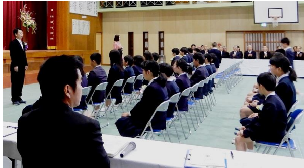
卒業証書授与式の様子