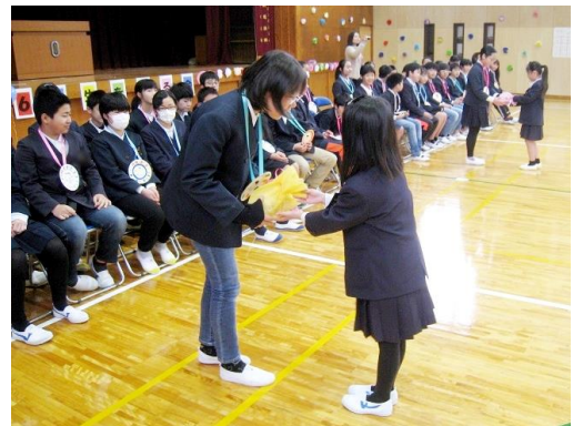
下級生からプレゼントを受け取る6年生

三月四日(月)に六年生を送る会を行いました。この一年間、登下校をはじめ、様々な場面でお世話になった六年生。卒業を前に、下級生がお礼の気持ちを伝えたり、プレゼントを渡したりしました。下級生から贈られた言葉やプレゼントに、六年生はともうれしそうでした。